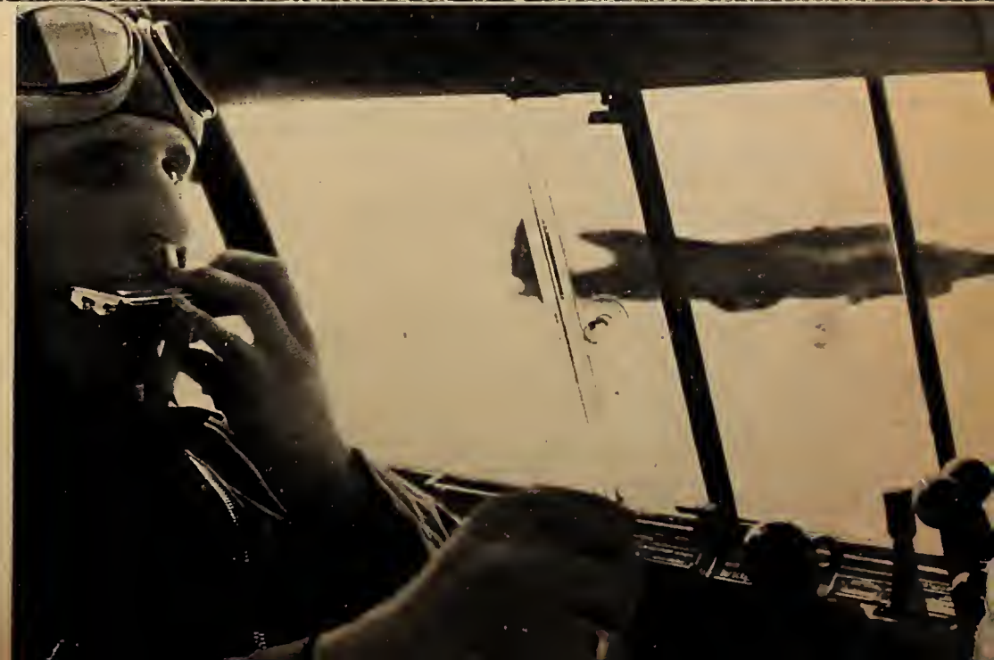
rechts, unten rechts: ... Frontgeist! ... einer Kampfstaffel in- ... auf seiner „Bordkapelle“ ... der Deutschen in Polen